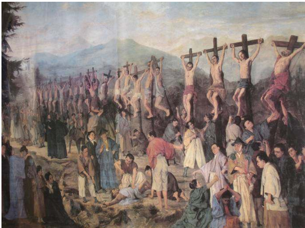
Razapinjanje prvih japanskih mučenika – Franjevački muzej u Kyotu

Ti mučenici navode nas na preispitivanje vlastitoga zauzimanja u naviještanju evanđelja u svojoj okolini, ne samo riječima, nego i svojim životom. Hrabro i vjerno su posvjedočili za Krista evangelizacijom, služenjem i prihvaćanjem progona te su zadržali beskraju nadu. Njihovo svjedočanstvo ilustrira poruku Benedikta XVI za Svjetski dan mira 2011., osobito kada je riječ o javnoj dimenziji vjere. Tu dimenziju moraju prepoznati i poštovati sva društva kao jedini put prema istinskome miru i cjelovitom ljudskom razvoju.